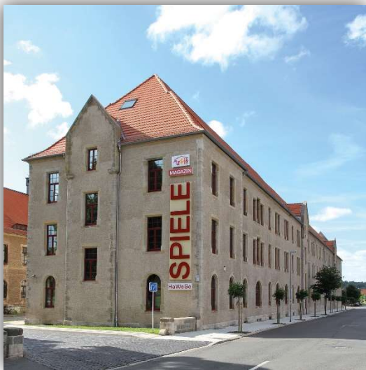
HaWoGe-Spiele-Magazin Halberstadt